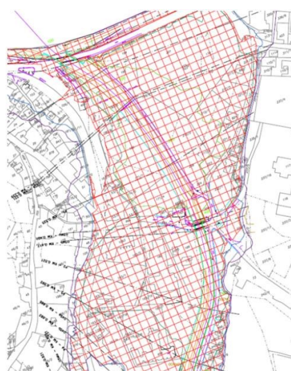
návrh aktivní zóny

Správce vodního toku musí při návrhu záplavového území vycházet z výše uvedené vyhlášky a územní plán po vydání opatření obecné povahy jej musí akceptovat. Návrh záplavového území nelze přizpůsobovat stávajícím územním plánům nebo budoucímu využití území.