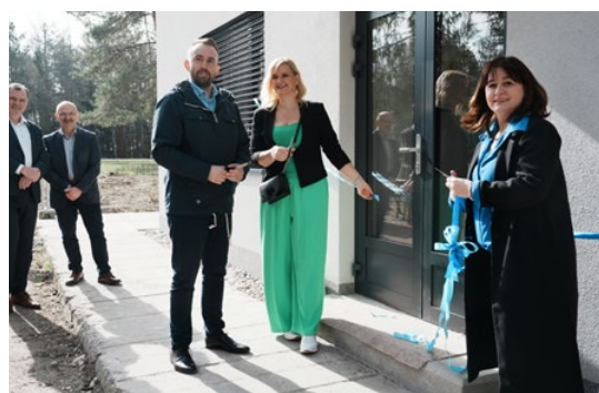
Hejtmanka Petra Pecková při slavnostním otevření sociálního zařízení následné péče Magdaléna o.p.s.

Středočeský kraj podpoří dva projekty zaměřené na pomoc lidem se závislostmi, kteří jsou ve vězení nebo byli po výkonu trestu propuštěni na svobodu. Na každý projekt kraj přispěje částkou 100 000 korun.